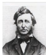
HENRI DAVID THOREAU