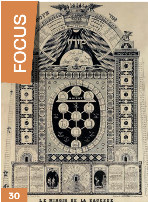
Musée de la franc-maçonnerie (coll. GODEF)